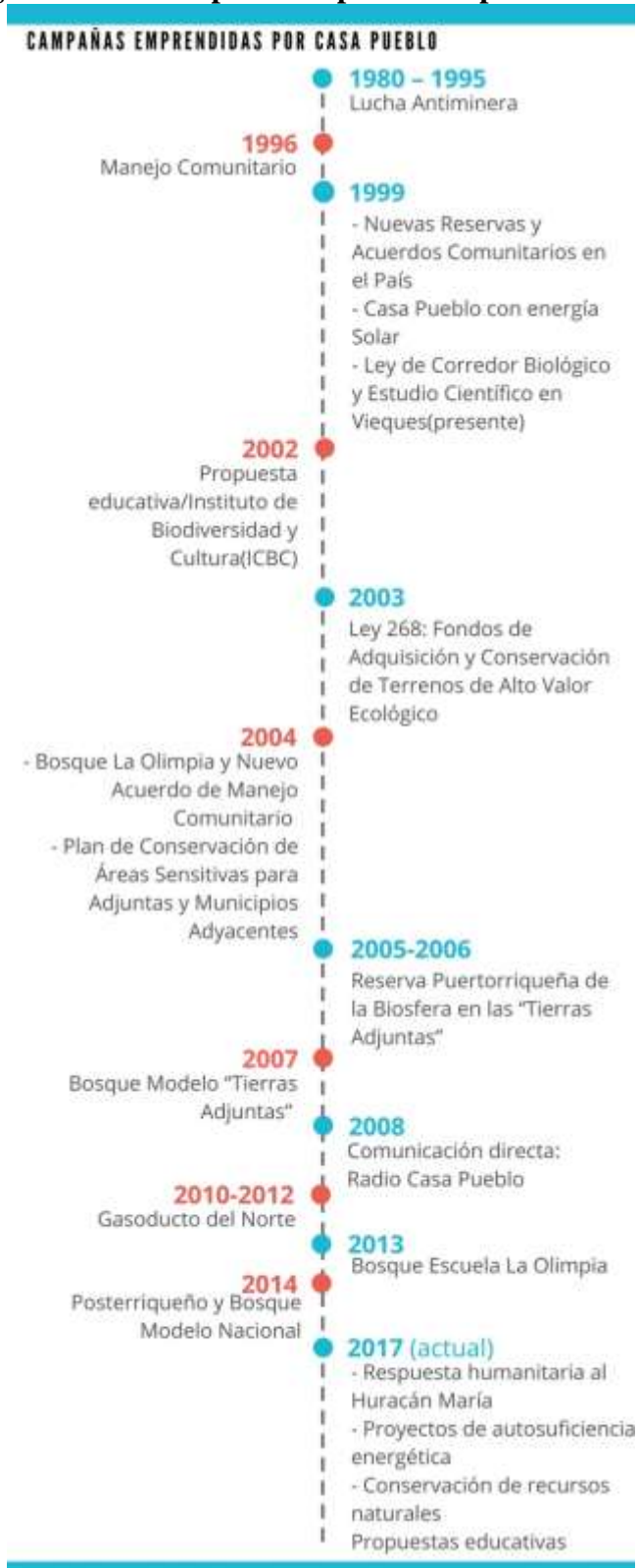
Diagrama III - Campañas emprendidas por Casa Pueblo

Las luchas son constantes y la organización no se detuvo con la lucha antiminera. Casa Pueblo avanza de acuerdo a la necesidad de defender el patrimonio humano en la isla (ver diagrama III).