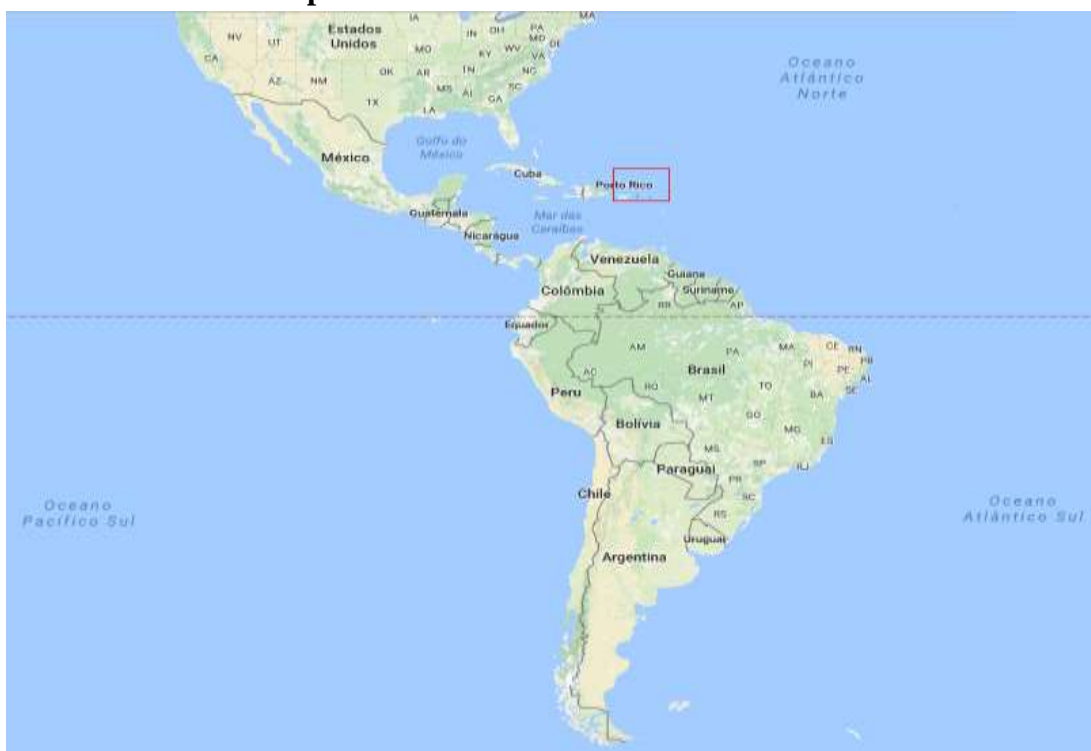
Mapa II - Ubicación de Puerto Rico

Para entender el contexto en que se plantea esta investigación, resulta necesario establecer las particularidades geopolíticas de esta nación caribeña (ver mapa I).