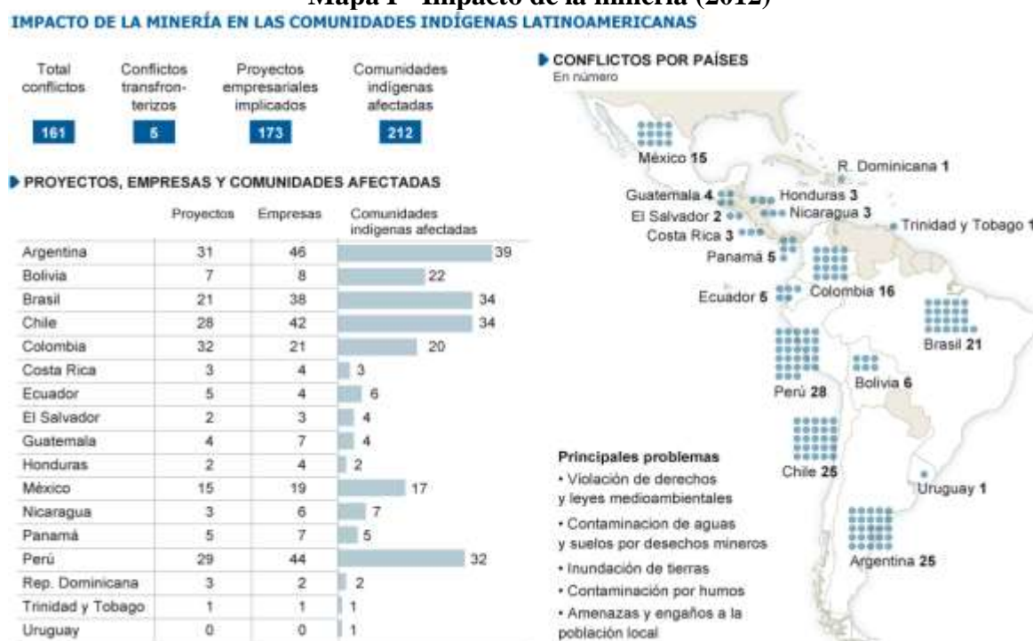
Mapa I - Impacto de la minería (2012)

Fuente: Observatorio del impacto minero de América Latina (OCMAL) Publicado en El País – 2012