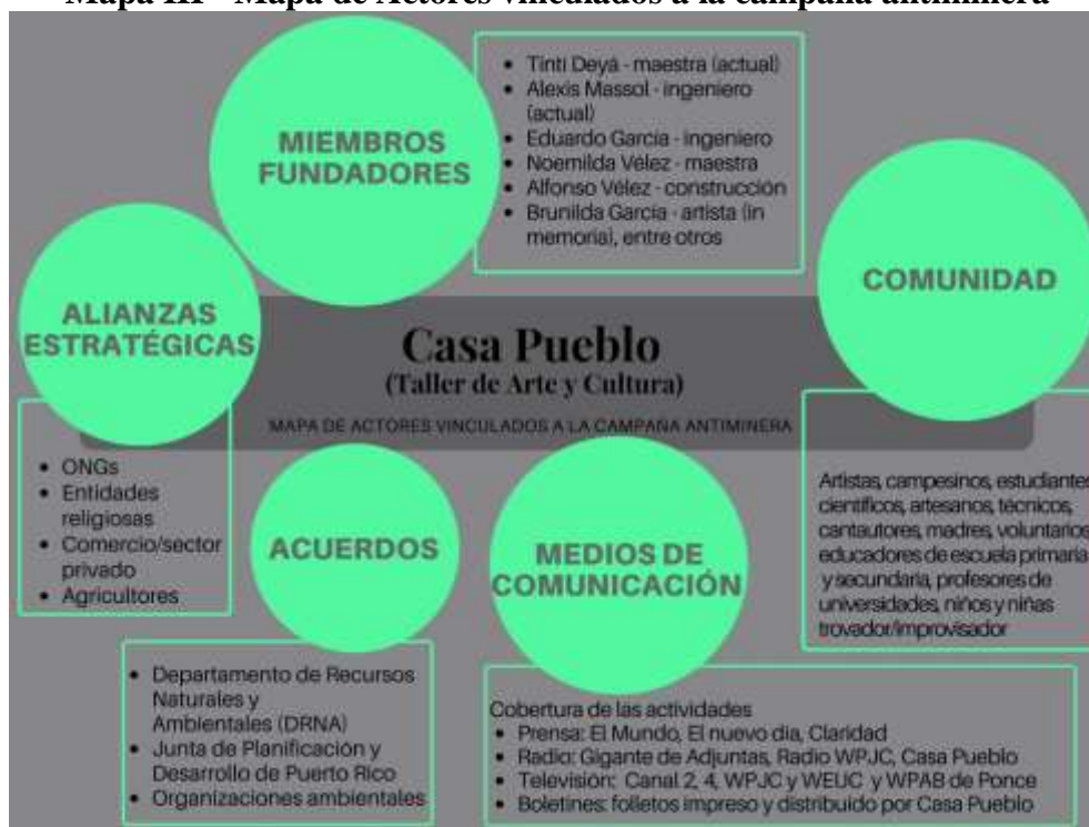
Mapa III - Mapa de Actores vinculados a la campaña antiminera

Con eso incluyeron la creación de espacios para la participación de diferentes actores ( ver mapa V ).