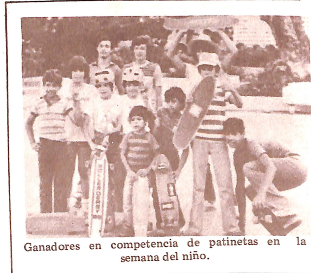
Ganadores en competencia de patinetas en la semana del niño.