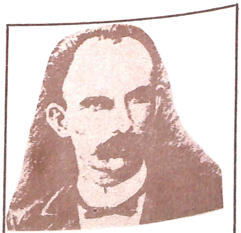
CITA HISTORICA "Es un crimen valerse de la aspiración gloriosa de un pueblo para adelantar intereses o satisfacer odios personales". JOSE MARTI (1853-1895)

A DJUNTEÑOS, cultivemos el espíritu, tu sensibilidad, tu delicadeza, tu sentimiento, tu orgullo y te harás digno hijo de este pueblo tan hermoso. Gocemos, apreciemos y conservemos la naturaleza que es tuya, es mía, es de aquél: Es Nuestra.